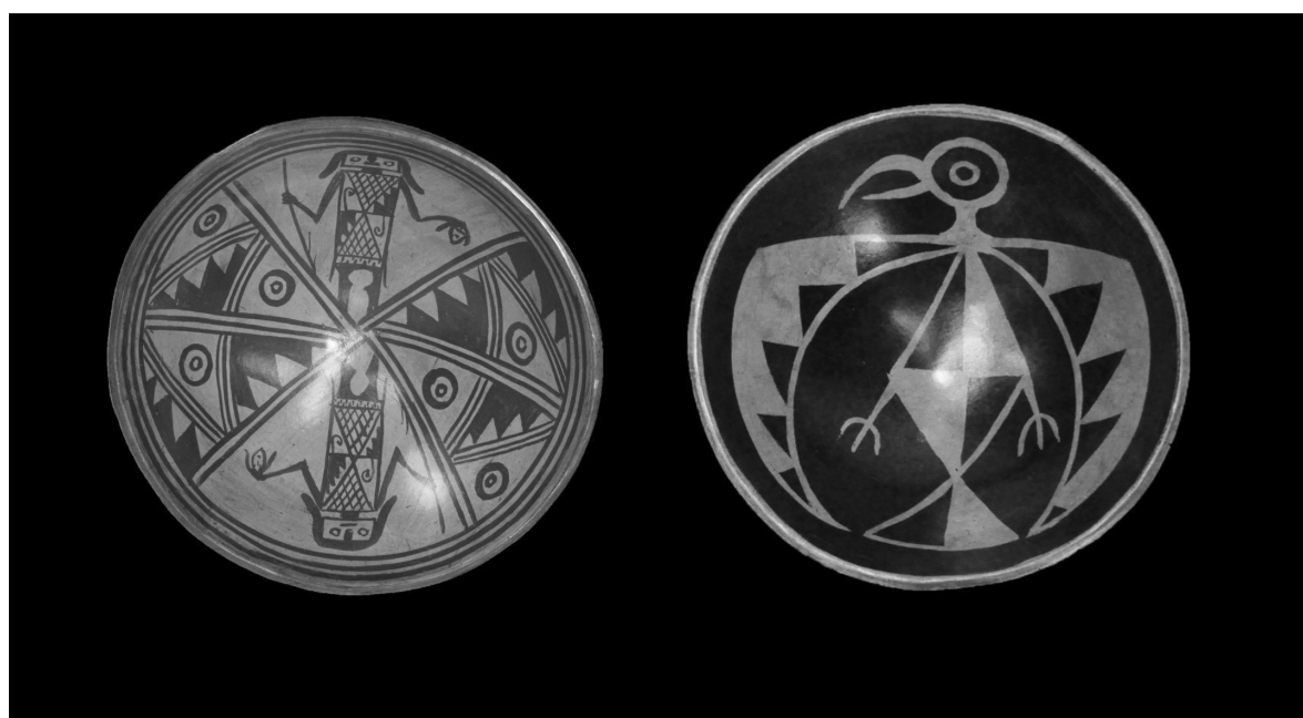
Figura 1. Platos de la Cultura Pasto.

El Tao de la física , por su parte, es un detallado y analítico documento que compara y relaciona la física moderna con filosofías orientales como el Tao y el budismo. Entre las investigaciones iniciales de mi carrera tuve una gran fascinación por las filosofías orientales y sus culturas visuales, por lo tanto, se trataba de un área que ya conocía y el libro me facilitó un entendimiento más profundo de los conceptos físicos. Capra utiliza gráficos tanto de física como de estas filosofías, los analiza y compara en sus estructuras simétricas. Su conclusión es que ambas búsquedas –la mística y la matemática– llegan a una misma verdad: la interconexión del cosmos (Capra, 1975). Este ejercicio de investigación me sirvió para darme cuenta de que las posibilidades para abordar el tema eran tan amplias como lo intuía y que todo se conecta. Esto me llevó a explorar dentro de mi red de asociaciones subjetivas para crear puentes conceptuales entre la física y distintas áreas de interés en mi práctica, como el arte precolombino.