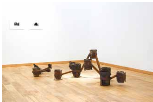
2. Vista de Horamen en el Museo de Arte Precolombino Casa del Alabado.