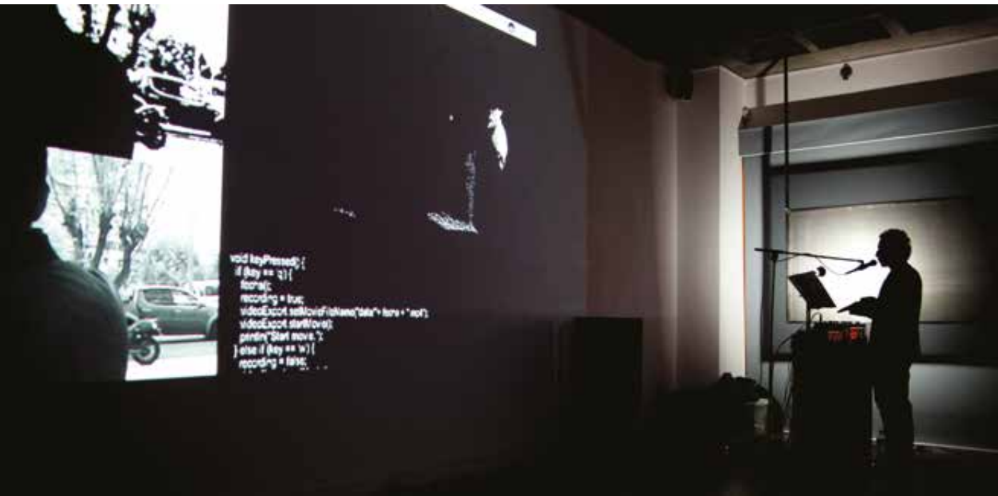
4. Interior de la sala. Detalle de la actuación del storyteller junto a la pantalla principal de proyección.

comprobó su textura y admiró su negrísimo color. Lo estiró, se hizo largo, muy largo. Lo puso en la basura, casi con pena. Una vez que se vaya, mezclado con todos los desechos de la ciudad, no existirá más. Todo rastro de su paso será borrado. Pasó, ya no hay nada que lo pruebe, que le pruebe. Había empezado a dudar de lo sucedido, de vez en cuando se inventaba historias. El cabello era una prueba de que lo que pasó, pasó... a medias.