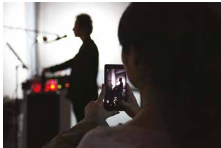
5. La actuación del storyteller registrada mediante un dispositivo intermediario.

La conjugación de la totalidad de métodos, herramientas y técnicas empleadas, ha generado una obra que requiere del desplazamiento corporal del viandante y de su participación e inversión subjetiva para completar la pieza.