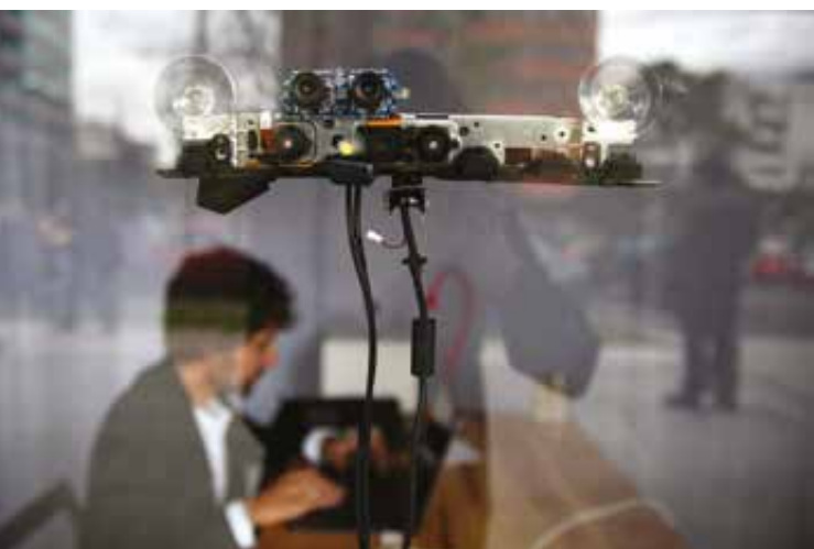
1. Detalle del dispositivo Kinect sobre el escaparate.

Register es un proyecto artístico site-specific que aborda la discontinuidad entre la inmediatez orgánica de la vida y el mundo simbólico, tal y como ya señalaron autores, desde Hegel (1807) hasta Badiou (2015), Žižek (2012) y Jameson (2009). Se ocupa del proceso que transforma la percepción de la realidad a través de una serie de dispositivos automáticos open source , en el que los artistas –presentes en todo momento– están inmersos en una labor de recolección, clasificación y ficción. El paso de la realidad (la calle) al mundo simbólico (la obra) se realiza a partir del registro de la máquina automática (Ruiz Martín, 2014) –previamente programada por un sistema complejo de algoritmos– (Figura 1), de la labor del register y de las narraciones sonoras ejecutadas por el storyteller . Los dispositivos manipulados e intervenidos aparecen destripados ante el espectador. Register convierte así la galería en un laboratorio de producción que emplea al viandante curioso como muestra azarosa, pero fundamental, en el desarrollo del proyecto.