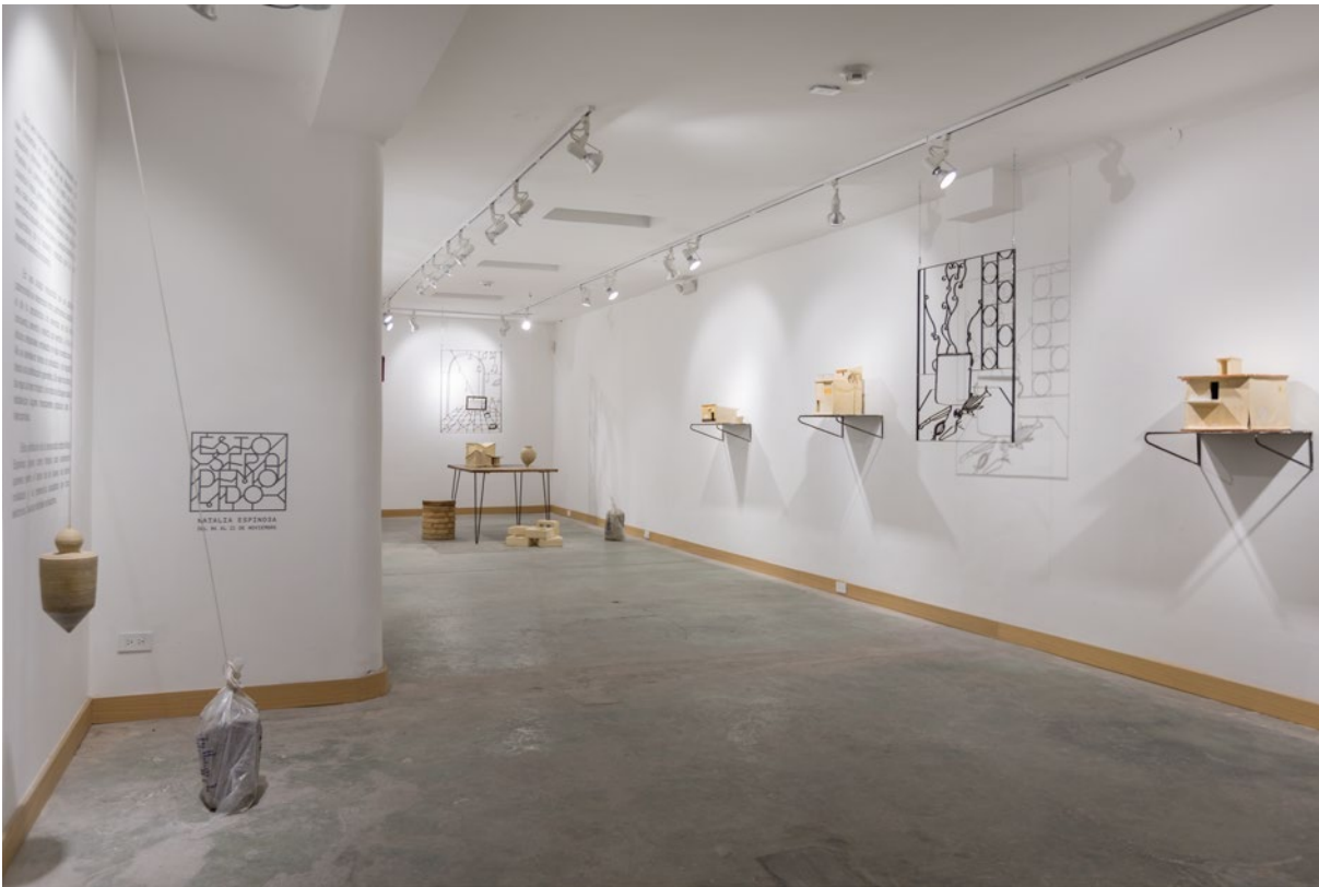
Fig. 1. Vista general de la muestra.

Quito es muy fotogénica filmada desde un dron, tal vez en un plano o una maqueta, pero, cuando se transita a pie por sus calles, es todo menos acogedor. El peatón no recibe preferencia, aunque esté lloviendo a cántaros. El transporte público está conformado por buses acelerados que hacen carreras homicidas echando humo a borbotones; los autos particulares y sus vías son los dueños de calles y veredas. Como caminante de la ciudad voy buscando elementos que me permitan conservar la calma en medio de este caos.