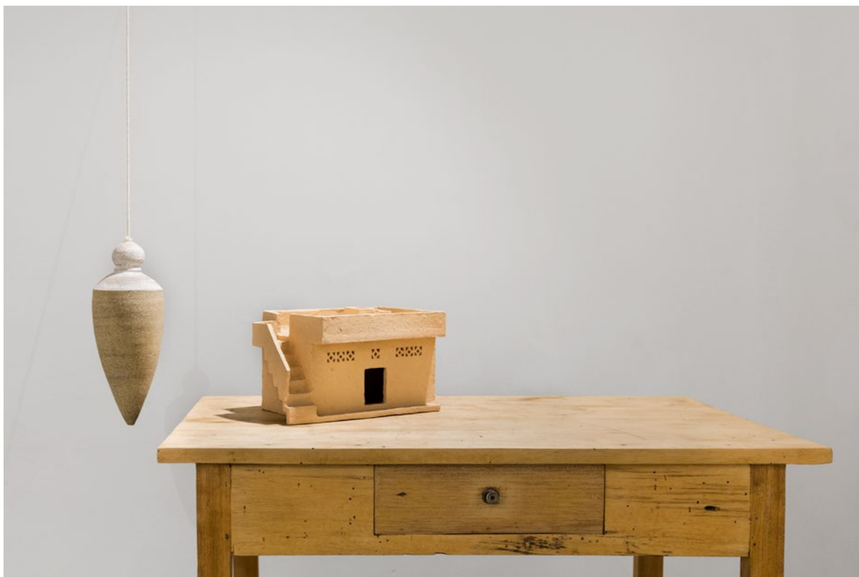
Fig. 2. Detalle de la muestra.