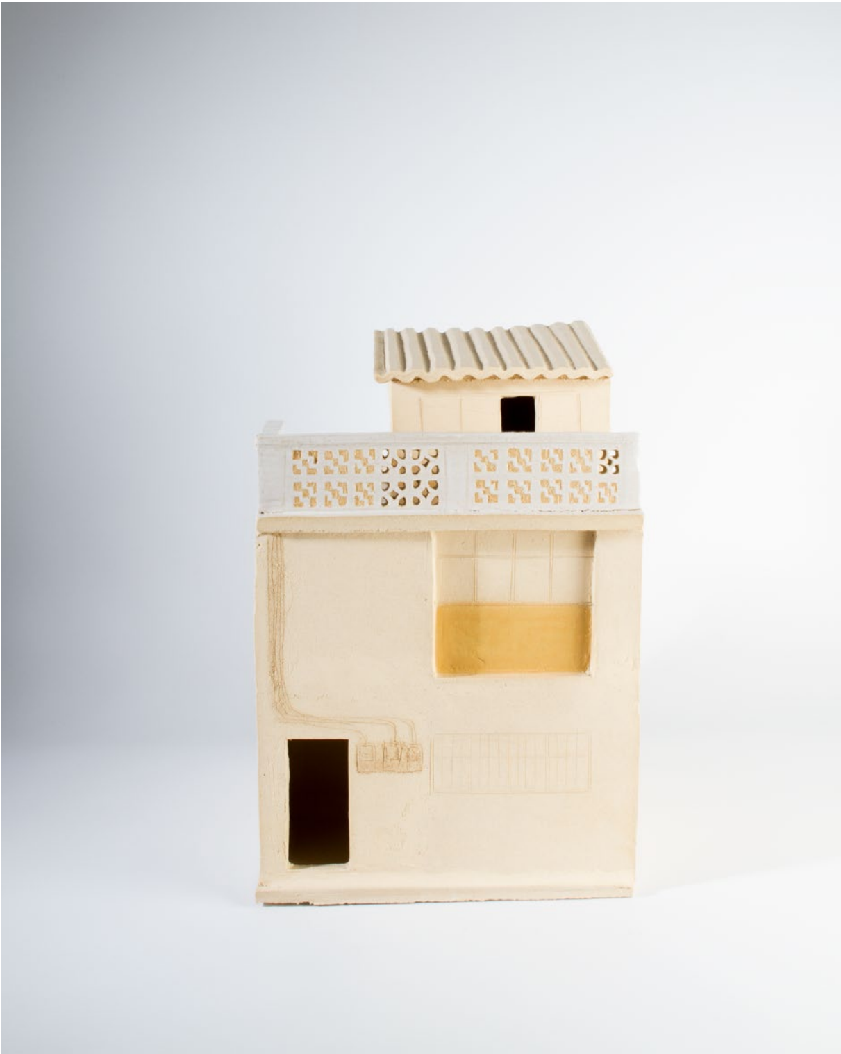
Fig. 4. Detalle de la muestra. Fotografía: Martina Avilés, 2019.