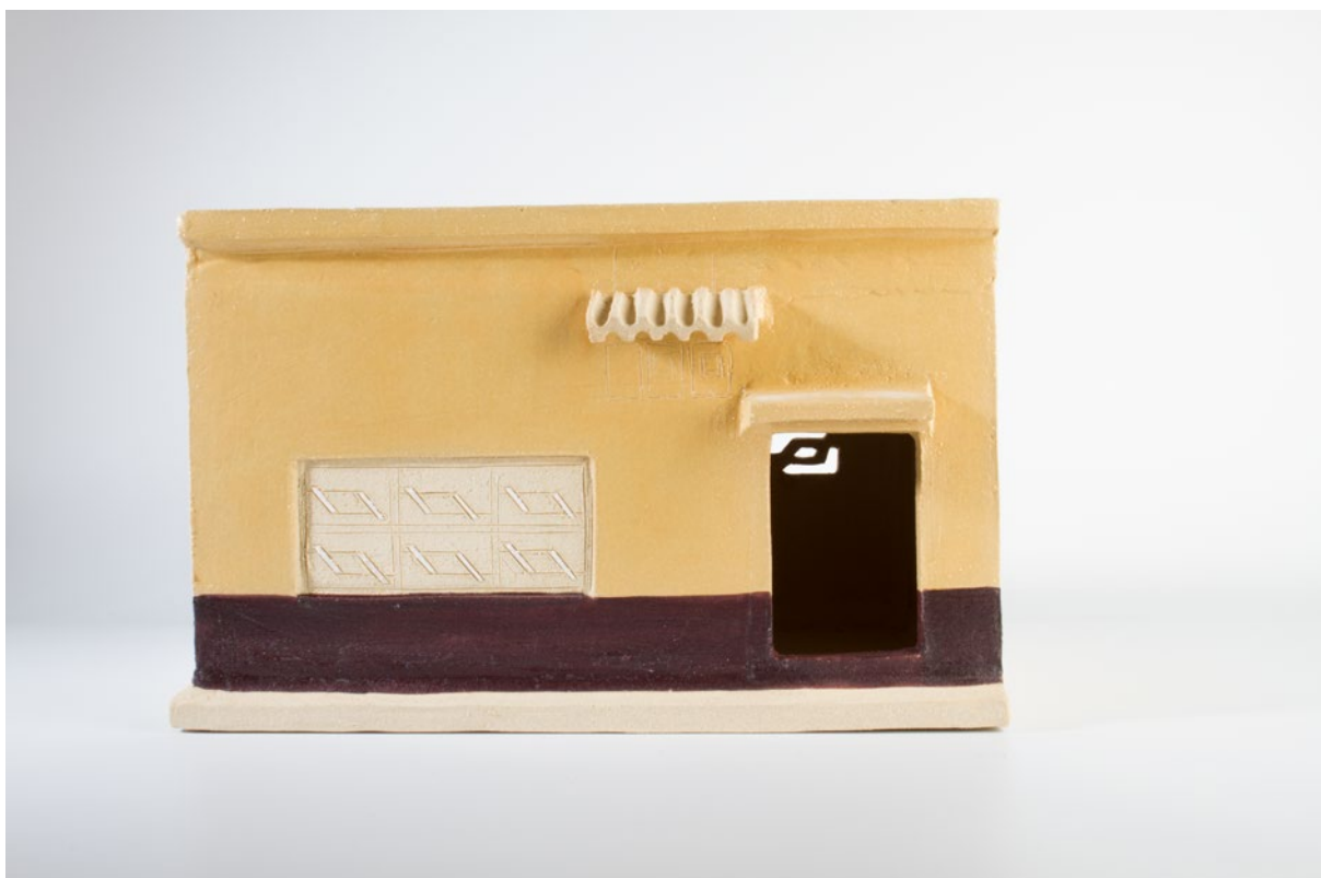
Fig. 3. Detalle de la muestra. Fotografía: Martina Avilés, 2019.