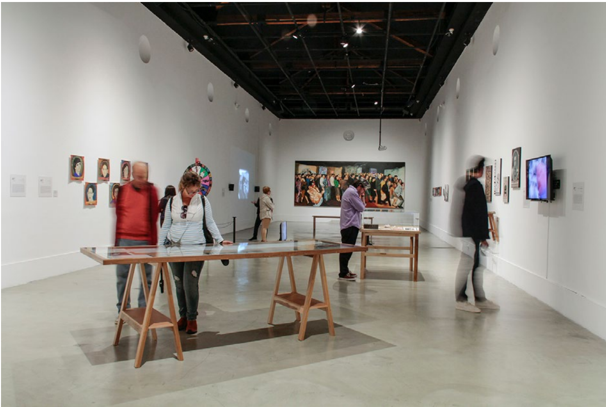
Figura 2. Vista general de la exposición Amarillo, Azul y Roto. Años 90: arte y crisis en Ecuador . Pabellón 4, Centro de Arte Contemporáneo de Quito.

Alvarado), sucesos como la migración que se dieron a fines de la década y afectaron a millones de ecuatorianos (Ñukanchik People). La extinta moneda nacional, el sucre devaluado, sirve como material artístico y argumento para objetos de arte, exposiciones, intervenciones y acciones en el espacio público (Proyecto Gran Feriado Bancario, Pepe Avilés y Patricio Palomeque).