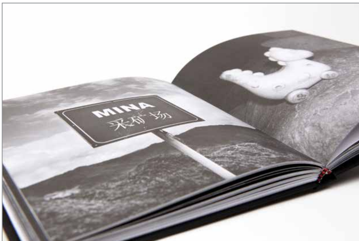
Fig. 1. Detalle de Mirador: visiones sobre el extractivismo. Ecuador 2000-2017. 2019.

La antropóloga y feminista argentina Rita Segato ha insistido en sus libros y declaraciones públicas sobre un concepto que no ha dejado de caracterizar las relaciones de poder en el mundo: la dueñidad o el señorío, el cual alude al alto y cada vez más intenso grado de concentración de la riqueza. En su libro La guerra contra la mujeres (2018), Segato precisa que señorío alude a que un pequeño grupo de “propietarios son dueños de la vida y de la muerte en el planeta. Son sujetos discrecionales y arbitrarios de un poder de magnitud nunca antes conocida, que vuelve ficcional todos los ideales de la democracia y de la república.”.