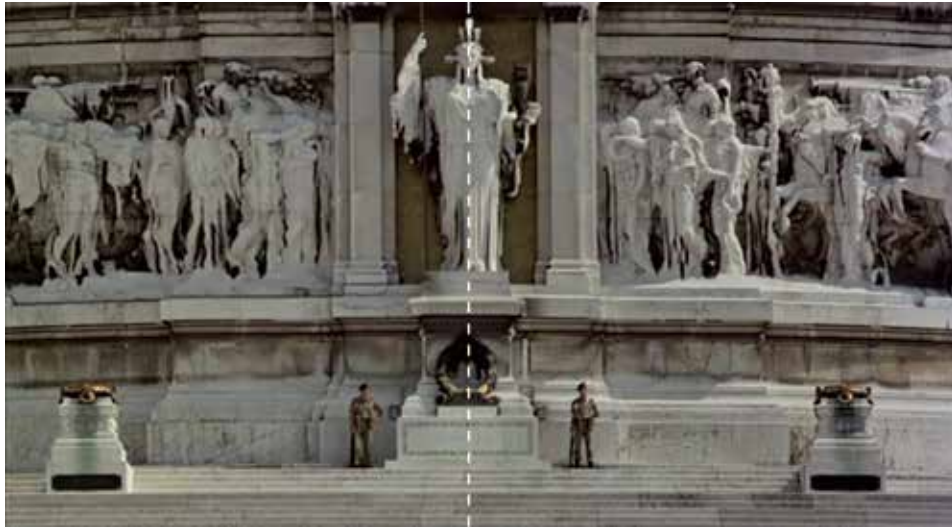
Figura 13: minuto 18:51

“La arquitectura construida por el hombre es la carne visible de una ciudad. Cuando nos paramos frente a una obra arquitectónica no estamos viendo una "cosa". Estamos contemplando la resulta de la dedicación de muchos antepasados. En el intestino humano se concentra la mayor parte de carne humana, preparada para ser convertida en carne de polis. No es de extrañar pues, que para el arquitecto de esta película el vientre suponga una obsesión. La carne es su potencial y su inspiración, y el vientre que a duras penas la alberga es su enfermedad”. FUENTE: http://revisordecine.blogspot.com/2014/05/el-vientre-del-arquitecto.html