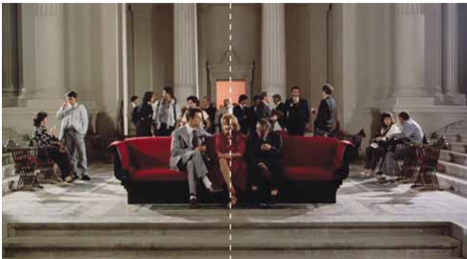
Figura 12: minuto 18:09

“Al realizar esta composición toma realmente elementos semejantes, primero que todo, de la estructura del comportamiento emocional del hombre , unido con el contenido experimentado de este o aquel fenómeno representado gráficamente”. (Eisenstein, 1967, p. 278).