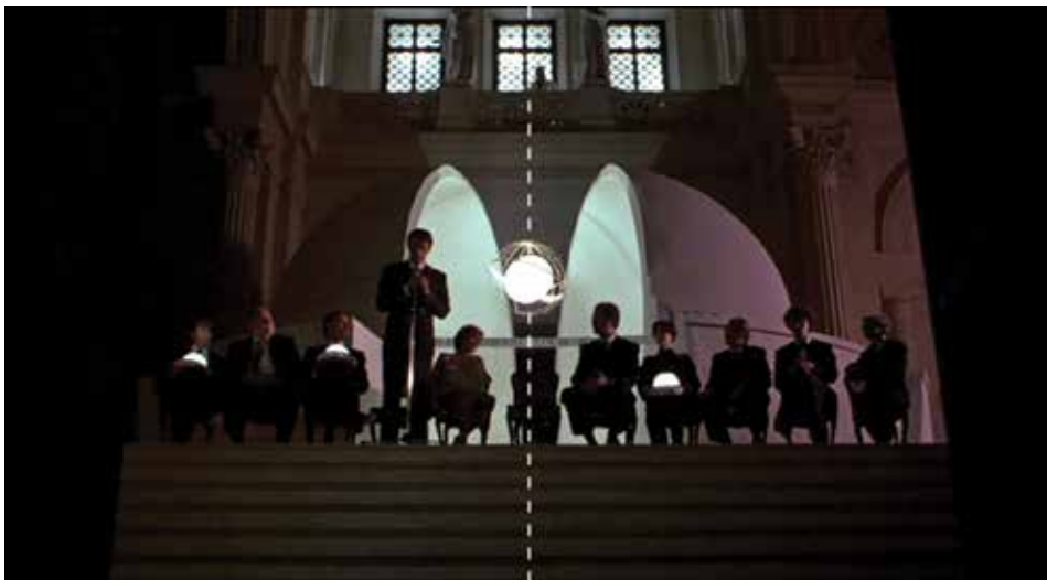
Figura 24: minuto 01:52:54