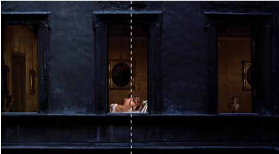
Figura 19: minuto 01:05:25

Deseo, traición, desventura, ¿será la piel culpable?