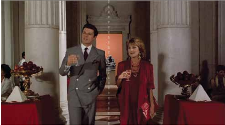
Figura 9: minuto 16:30

“En su camino irrumpirán los Speckler, una familia rival que conspirarán dispuestos a provocar su ruina. Caspasian, el mayor, le disputará no solo el amor de su mujer, también la concesión de un importante proyecto”. FUENTE: http://revisordecine.blogspot.com/2014/05/el-ventre-del-arquitecto.html