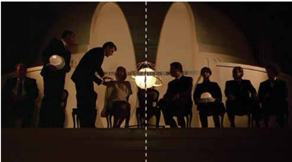
Figura 22: minuto 01:50:37

“Este marco de declive personal sirve a Peter Greenaway para criticar las infraestructuras anti-ideológicas que sustentan un arte siempre ideológico, la instigada codicia fruto (podrido) del capitalismo, y cómo unos trepas sin talento se llevan la fama y reconocimiento que corresponde a otros mientras estos observan su obra en desesperanzado anonimato”.