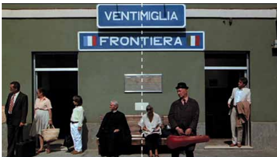
Figura 2: minuto 01:25

Veámoslo entonces con las imágenes de un film, ellas resultan contundentes. Escoger una película de entre la extensa filmografía de Greenaway ya es una tarea compleja, por eso hemos preferido operar a la inversa. Por cualquier razón que sea, la película que tomaremos como ejemplo, The belly of an architect (1987) nos ha escogido a nosotros... En orden cronológico iremos mostrando algunas imágenes congeladas de dicha película incluyendo al pie de cada una, ciertos comentarios y citas que configuran el modelo interpretativo. Dejamos en ocasiones la pura muestra del encuadre con el dibujo en línea punteada del eje de simetría, para una libre y abierta interpretación a cargo del lector. En definitiva, este ejercicio no pretende de modo alguno ser más que un sondeo subjetivo y sintomático: