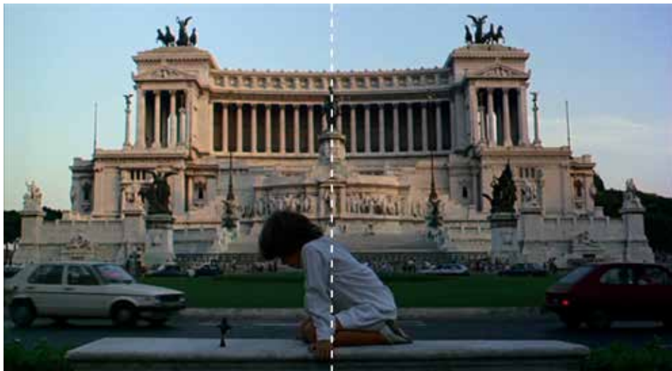
Figura 26: minuto 01:55:15