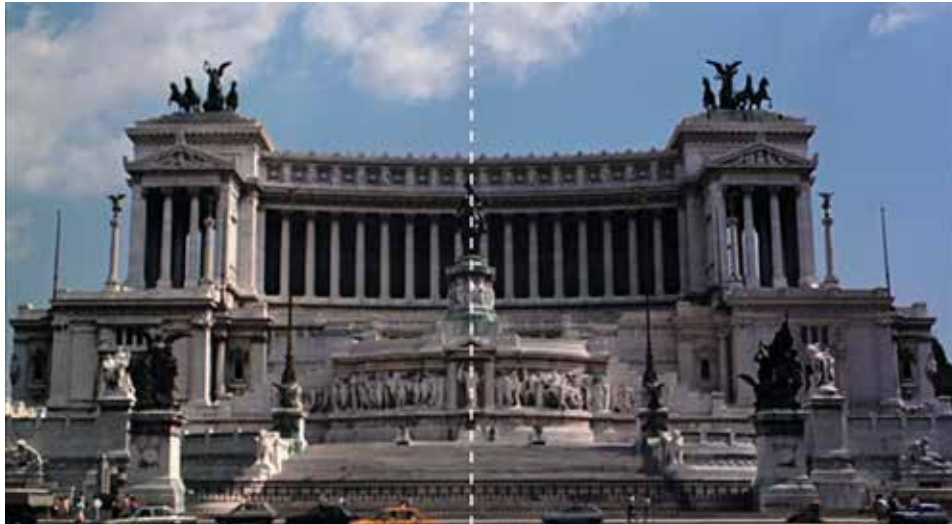
Figura 5: minuto 15:16

El marco de los monumentos patrimoniales de Roma, redunda en el mensaje, no es simétrica únicamente la composición, también el edificio lo es. “Tal posibilidad de repetición es lo que contribuye ante todo a dar una sensación de unidad” (Eisenstein, 1967, p. 386).