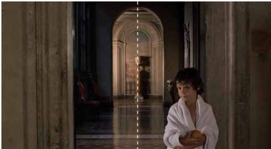
Figura 18: minuto 57:13

Sorpresa y misterio. La agresividad de las puertas cerradas. Más un símbolo.