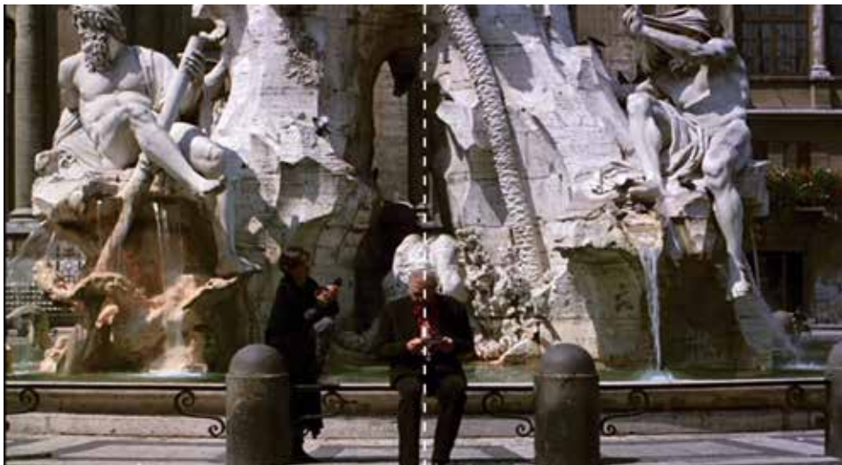
Figura 20: minuto 01:09:51

Deseo, traición, desventura, ¿será la piel culpable?