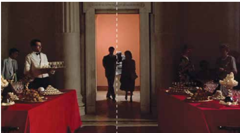
Figura 8: minuto 16:09