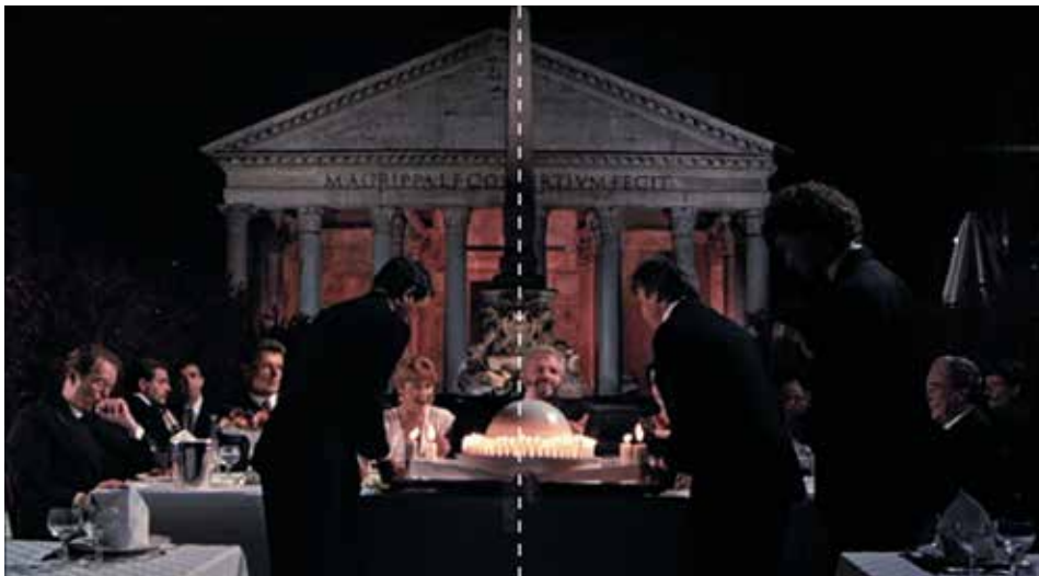
Figura 4: minuto 04:08

El arribo a la ciudad, Roma en todo su esplendor. Hay referencias a la escala monumental, se incluyen personas y vehículos para establecer comparaciones. La perspectiva con fuga en el fondo inferior relata la situación inicial, los monumentos de base sólida. Al momento se presume una estabilidad emocional del personaje principal, el arquitecto estadounidense Stourley Kracklite (interpretado por Brian Dennehy).