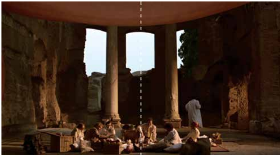
Figura 16: minuto 39:04

...“La composición con ánimo pictórico de los planos está bendecida con el mágico barniz de lo atemporal, los encuadres perfectamente simétricos de enclaves romanos despiertan el sentido del asombro, los reflejos del agua nos sumergen en la melancolía, y la iluminación usando diferentes colores aporta un lúgubre misticismo y riqueza simbólica a un buen número de escenas”. FUENTE: http://revisordecine.blogspot.com/2014/05/el-vientre-del-arquitecto.html