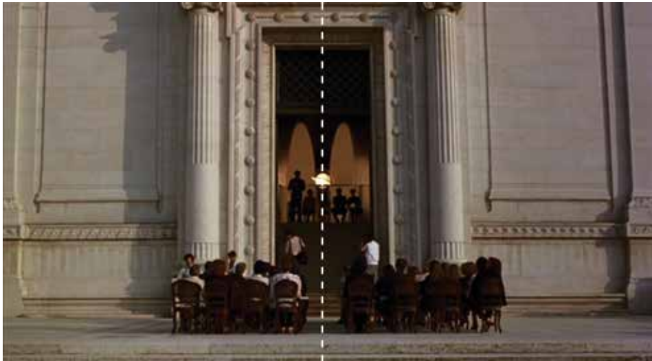
Figura 23: minuto 01:50:52