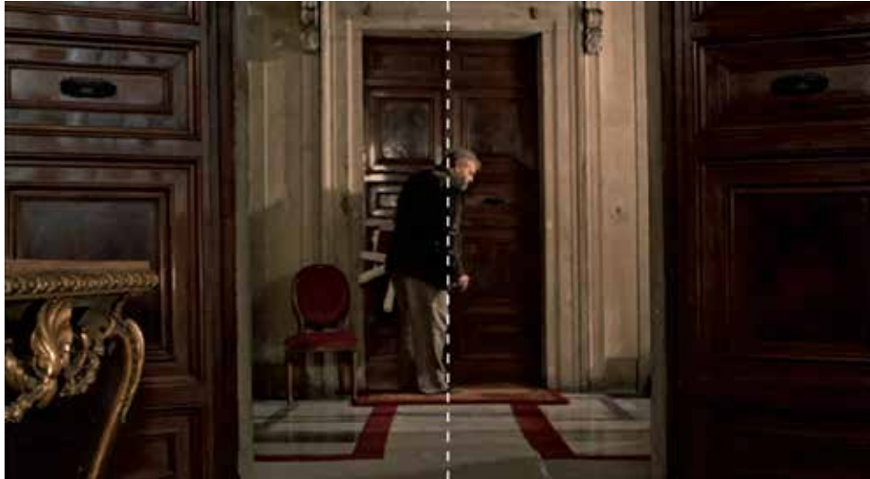
Figura 17: minuto 56:22

Sorpresa y misterio. La agresividad de las puertas cerradas. Más un símbolo.