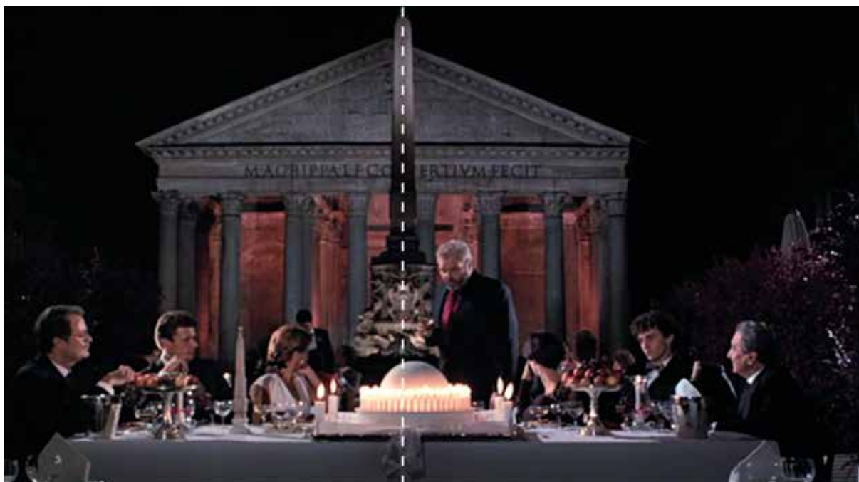
Figura 1: Escena de la película “El vientre del Arquitecto”, minuto 05:16

GREENAWAY, Peter. The belly of an architect . Largometraje de 108 min. Reino Unido, 1987