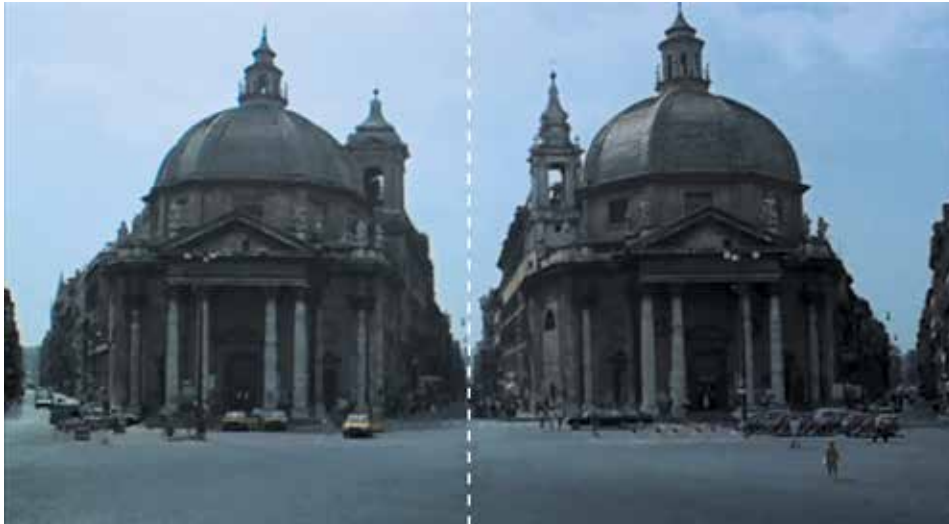
Figura 3: minuto 03:01

El arribo a la ciudad, Roma en todo su esplendor. Hay referencias a la escala monumental, se incluyen personas y vehículos para establecer comparaciones. La perspectiva con fuga en el fondo inferior relata la situación inicial, los monumentos de base sólida. Al momento se presume una estabilidad emocional del personaje principal, el arquitecto estadounidense Stourley Kracklite (interpretado por Brian Dennehy).