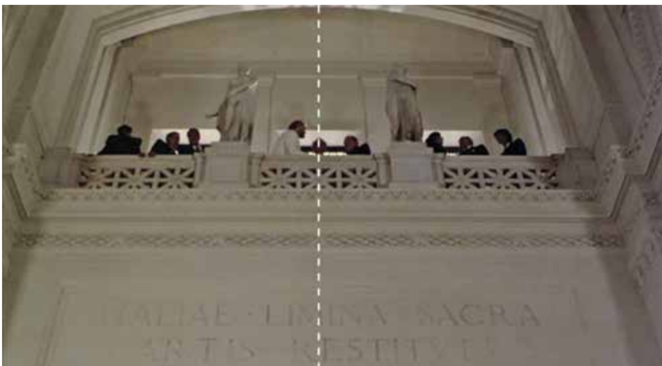
Figura 10: minuto 16:46

“En su camino irrumpirán los Speckler, una familia rival que conspirarán dispuestos a provocar su ruina. Caspasian, el mayor, le disputará no solo el amor de su mujer, también la concesión de un importante proyecto”. FUENTE: http://revisordecine.blogspot.com/2014/05/el-ventre-del-arquitecto.html