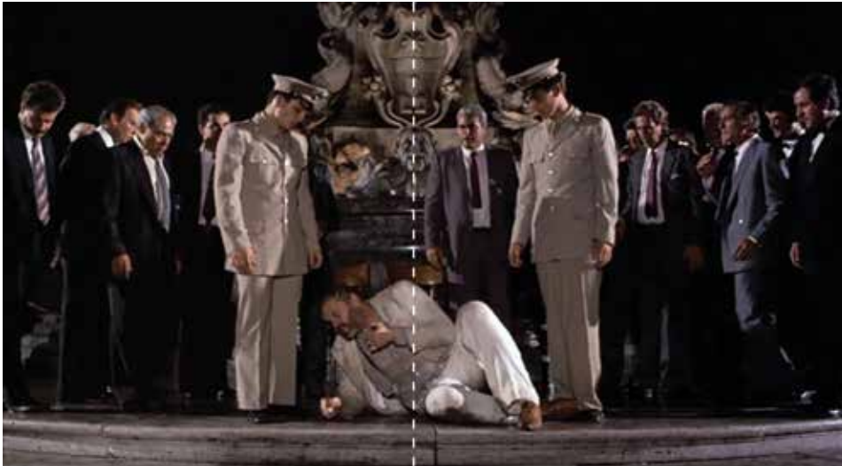
Figura 21: minuto 01:43:45

“Este marco de declive personal sirve a Peter Greenaway para criticar las infraestructuras anti-ideológicas que sustentan un arte siempre ideológico, la instigada codicia fruto (podrido) del capitalismo, y cómo unos trepas sin talento se llevan la fama y reconocimiento que corresponde a otros mientras estos observan su obra en desesperanzado anonimato”. FUENTE: http://revisordecine.blogspot.com/2014/05/el-vientre-del-arquitecto.html