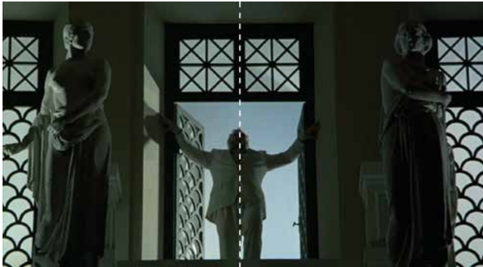
Figura 25: minuto 01:54:32