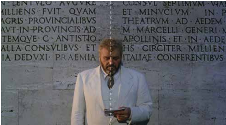
Figura 15: minuto 24:48