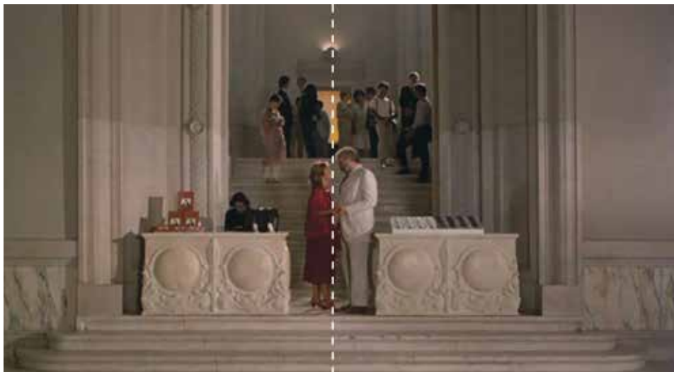
Figura 14: minuto 22:30

“La arquitectura construida por el hombre es la carne visible de una ciudad. Cuando nos paramos frente a una obra arquitectónica no estamos viendo una "cosa". Estamos contemplando la resulta de la dedicación de muchos antepasados. En el intestino humano se concentra la mayor parte de carne humana, preparada para ser convertida en carne de polis. No es de extrañar pues, que para el arquitecto de esta película el vientre suponga una obsesión. La carne es su potencial y su inspiración, y el vientre que a duras penas la alberga es su enfermedad”. FUENTE: http://revisordecine.blogspot.com/2014/05/el-vientre-del-arquitecto.html