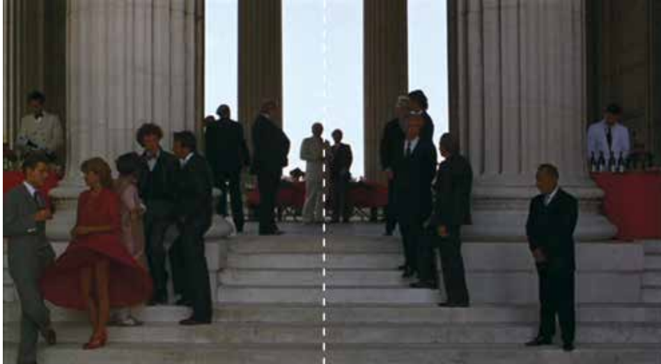
Figura 7: minuto 15:31

Resalta la distribución de los personajes, aparentemente relajada y espontánea, colocados en el cuadro, incentivando la perspectiva y dirigiendo la mirada al personaje principal como una flecha. Hay cierta indiferencia entre los asistentes; sin embargo, se advierten ciertos nexos peligrosos. Nótese el uso del color como elemento simbólico. Hay un diálogo entre el vestuario y el escenario.