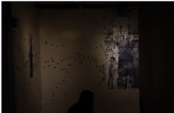
Figura 10. Era en sala, Autor: Dibujo instalación. sobre papel, los son mariquitas de con fotocopiadora, sala. Fotografías:

Demás está decir que una de las primeras inscripciones que hace la ley es la del género y la sexualidad. Mayro dice “hay verbos que aprendí en la escuela y que nunca olvidé, algunos fueron las primeras palabras que aprendí, las primeras imágenes que mi mente retuvo para definir mi alteridad”. Los verbos que replican la ley dan forma a la carne y jerarquizan lxs cuerpxs. Una reflexión similar hace Stuart Hall al pensar las maneras en las que él supo de la relación con un mundo que precedía su propia existencia pero que no dejó de atravesarlo “era tres tonos más oscuro que mi familia y es el primer hecho social que sabía de mí mismo” (Hall en Bidaseca, 2019). Después de la inscripción cruel de la ley solo nos queda la tensión entre este momento –y sus consecuencias– y la potencialidad