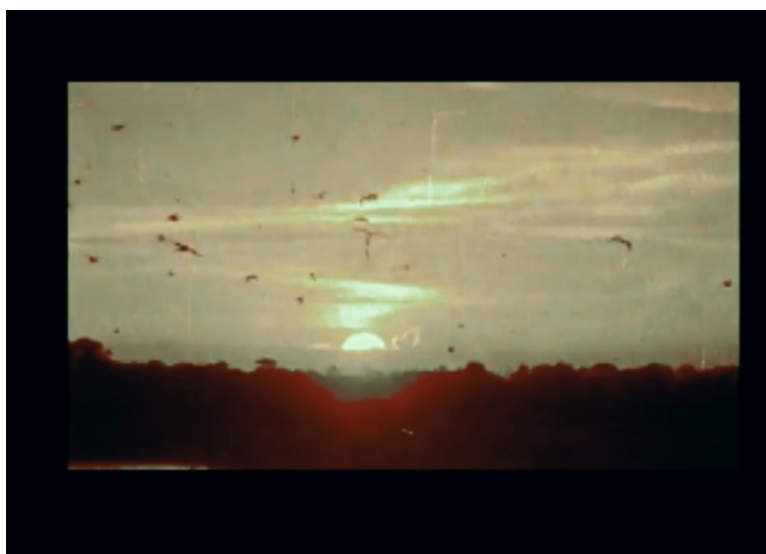
Figura 11. Aves suicidas frame. Autor: Mayro Romero. Video. Duración: 7'46''. Año: 2021.

[...] furioso por el tratamiento que recibe, un trabajador participa en una huelga salvaje: sin embargo, sólo cuando, después de haber actuado, lo cuenta/lo vuelve a contar como un acto de lucha de clases, el trabajador se transforma en el sujeto revolucionario, y, de acuerdo a esta transformación, puede seguir actuando como un verdadero revolucionario (p.131).