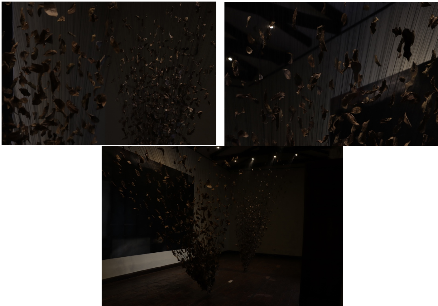
Figuras 2, 3 y 4. Seres invernaderos (fragmentos). Autor: Mayro Romero. Instalación con hojas secas e hilos. Dimensiones Variables. Año 2018. Fotografías: Belén Alvarado.