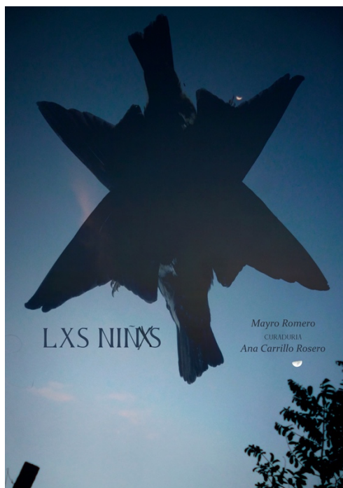
Figura 1. Afiche de la muestra. Autor: Mayro Romero. Julio 2021.

Les niños es para mí aquella idea que ha tomado cuerpo y aun así no aligera su carga, ni olvida el temor de su presencia. Les niños toma mucho de los elementos del cuento infantil y de las fábulas para estructurar un mundo fantástico y melancólico, una mezcla que ficciona materiales y los conjuga en un simulacro de archivo recompuesto de manera poco convencional.