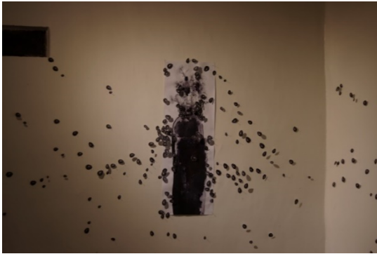
Figuras 8. 9 y aseuna vez vista Mayro Romero. Año 2021. Tinta círculos negros papel, hechas inundan toda la Belén Alvarado.