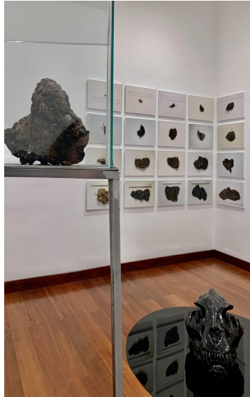
Figura 4. (izq-der). Detalle de Costra , Inscripción Ñuthse Cansefaye sobre pasivo de petróleo realizado con Croton lechleri (Sangre de drago). Ñuthse Cansefaye significa “Buen Vivir” en lengua AI’Cofán. Detalle de Archivo , 20 fotografías impresa sobre papel. 50 x 31 cm. c/u Selección de 20 muestras de pasivos de petróleo petrificados provenientes del bloque 62 Tarapoa. Esta selección forma parte de un registro fotográfico de 314 muestras de petróleo, encontrados en 2 quintales de pasivos de petróleo. Estas piedras de petróleo han sido medidas y pesadas. (Der-inf) Detalle de La caída del Jaguar , Cráneo de Jaguar de petróleo. Realizado con 310 muestras de pasivos de petróleo petrificados provenientes del bloque 62 Tarapoa, resina poliéster y metacrilato negro.

La investigación que viene realizando mediante largos procesos de trabajo enlazados con territorios que sufren explotación extractiva (debido a encargos laborales que lo han ubicado estratégicamente en estos sitios) lo han llevado a seguir poniendo a prueba a nivel metodológico y sensorial, acciones experimentales para el procesamiento de materiales generados mediante la extracción de petróleo de rocas petrificadas o el uso de resinas naturales contenedoras de pigmentos con los cuales consigue fluidos que a posteriori , emplea a manera de “pintura” sobre soportes tradicionales.