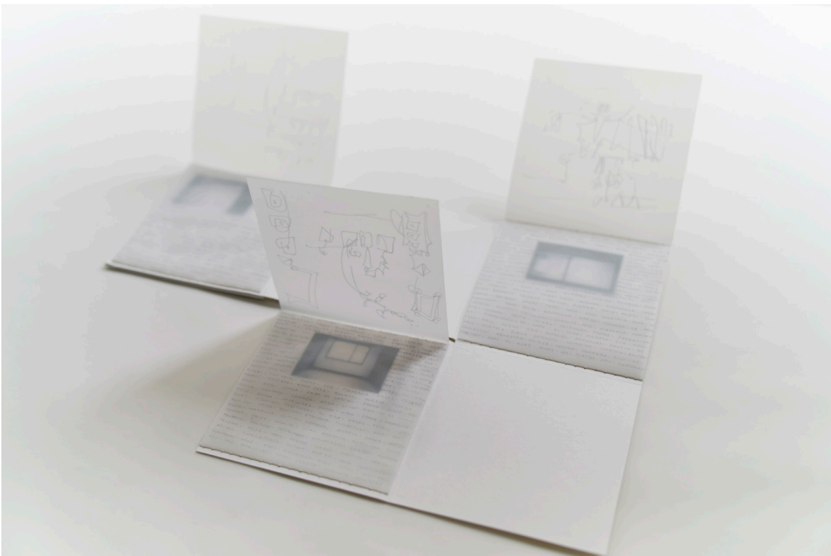
Figura 4. Pamela Corrales, Dommun . Vista de la instalación en Galería Parterre Quito, 2023.