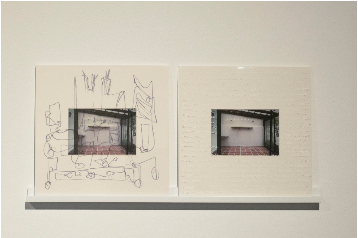
Figura 5. Pamela Corrales, Dommun . Vista de la instalación en Galería Parterre Quito, 2023.