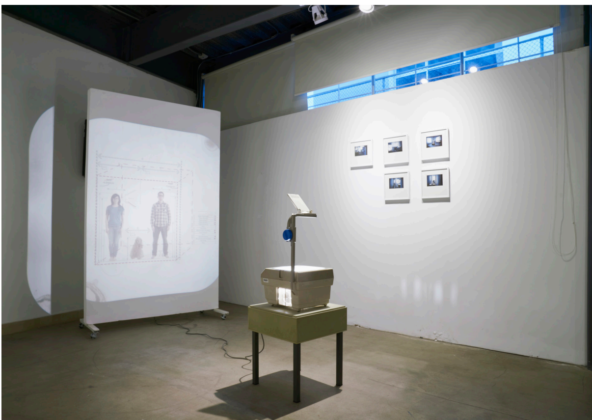
Figura 2. Pamela Corrales, Dommun . Vista de la instalación en Galería Parterre Quito, 2023.