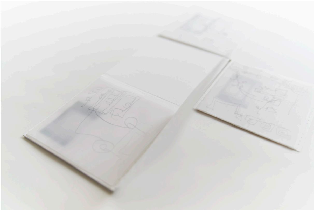
Figura 3. Pamela Corrales, Dommun . Vista de la instalación en Galería Parterre Quito, 2023.