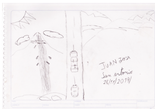
Figura 1. Dibujo+mapa 1: Desplazamiento desde Perú hacia Chile. Archivo del proyecto de investigación+creación de arte andante (walking art) Paisajes Migrantes Andinos. 2019.